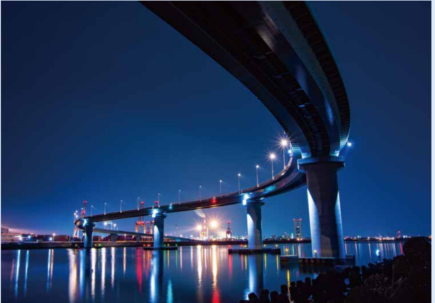
題名：あの街へ 「写真家の間では有名な三重県四日市市のいなばポートラインの夜景です。」