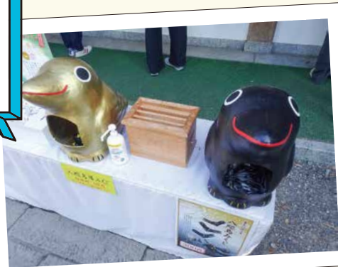
Uさん撮影「熊野本宮 八咫鳥みくじ」