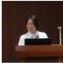
③吉倉感染管理認定看護師