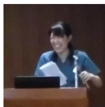
⑥益満救命救急科医師