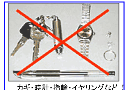
カギ・時計・指輪・イヤリングなど